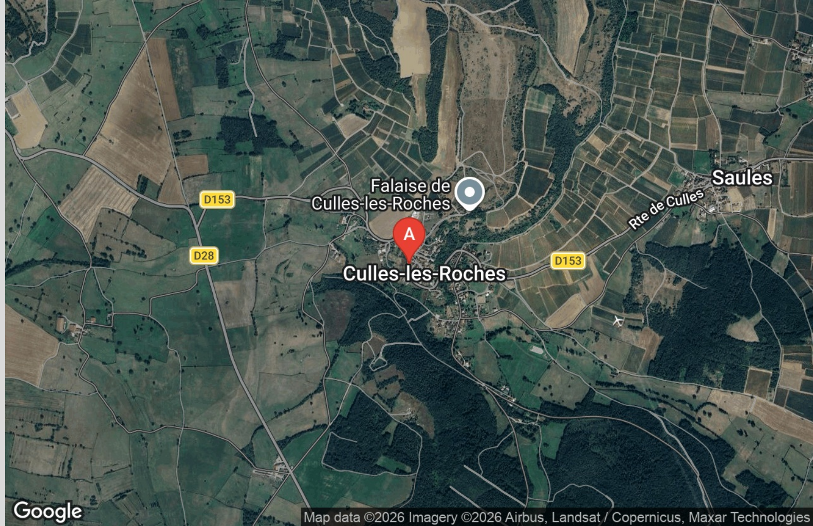
A Maison La Riotte - Culles-Les-Roches : 14 Route de la Guye 71460 CULLES-LES-ROCHES